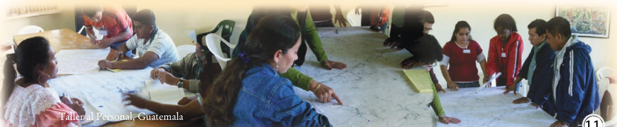
Taller al Personal, Guatemala

En el marco de la estrategia de inserción institucional del tema, el personal de Save the Children Guatemala participó en un taller de formación sobre trata de personas como parte del interés institucional de contribuir, en el tema de prevención y protección de la trata en Guatemala, contando con la participación de un equipo multidisciplinario de varias zonas del país que se encargará de coordinar con organizaciones gubernamentales y no gubernamentales las acciones previstas en el Convenio.